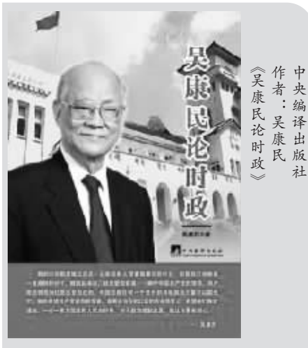
中央编译出版社 作者：吴康民 《吴康民论时政》

于是众多的庸才出现了。庸才也并不是天生不聪颖,而是在这个大气候下,被塑造成一个循规蹈矩、肃规曹随、上行下效、四平八稳、面面俱圆、“孺子可教”的“乖学生”。这种人容易脱颖而出