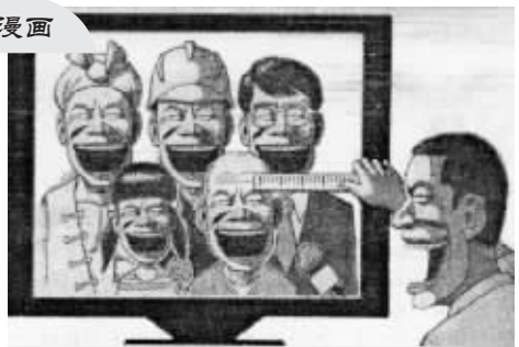
你幸福吗? 摘自《新民晚报》罗杰/图

话说某位女士一时兴起,买了一只母鸚鵡。没想到带回家里,它说的第一句话就是:“想跟我上床吗?”女士一听,心想:坏了,外人还以为这话是我教的呢,这可不把我的淑女形象全给毁了。她想尽办法,教那只鸚鵡说些高雅的话,可那只母鸚鵡算是铁了心,只会说一句话:“想跟我上床吗?” 怎么办呢?在女士束手无策之时,她听说神父那里养了一只公鸚鵡,那只鸚鵡不但不讲粗话,而且是个虔诚的教徒,每天大部分时间里都在祷告。 那位女士去找神父求助。神父明白她的来意之后,面露难色:“这个,很难办呀。其实那只鸚鵡,我并没有刻意教它什么,它这么虔诚,也可能是长期在此受熏陶的缘故吧。”