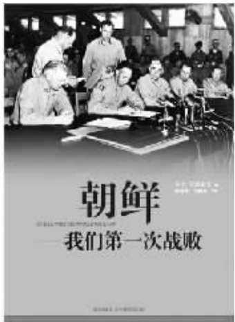
新星出版社 作者：贝文·亚历山大(美) 《朝鲜我们第一次战败》

270名朝鲜人被打死,200人被俘,而澳大利亚人只有7人受伤。 ▲1950年8月16日,麦克阿瑟命令美军用98架B-29轰炸机对67平方公里的地区,发起了一次效果相当于三万发重型炮弹的地毯式轰炸,不过连一个朝鲜士兵也没有炸死或炸伤。 ▲1950年10月21日,麦克阿瑟在攻占平壤后检阅了最早进入平壤的第5骑兵团F连,他命令96天前作为该连成员来到朝鲜的军人出列。那时该连有将近两百人,这时出列的只有五个人,其中三个有伤在身。 ▲1951年8月10日,朝鲜战争停战和谈中,双方隔桌而坐,由于互不信任,长达2小时又11分钟一言不发,直至休会。 ▲朝鲜战争期间先后有三个人——麦克阿瑟、李奇微和克拉克担任美军远东司令,其中麦克阿瑟和克拉克都曾建议使用蒋介石在台湾的军队,并在必要时对中国使用原子弹;而李奇微则一直在自己的军装夹克上别着一颗手雷。