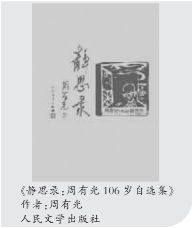
《静思录:周有光 106岁自选集》作者:周有光 人民文学出版社

△世界各国都在同一表演进轨道上竞走,有快有慢,有先有后,有偏离轨道,重又回归,有道外徘徊,终于上轨。先进和落后之间相差一万年。流传最广的是五阶段论:原始社会,奴隶社会,封建社会,资本主义,共产主义(初级阶段称社会主义)。苏联瓦解,证明社会主义是理想,资本主义是现实,二者性质不同,不能相提并论。五阶段论要重新研究。