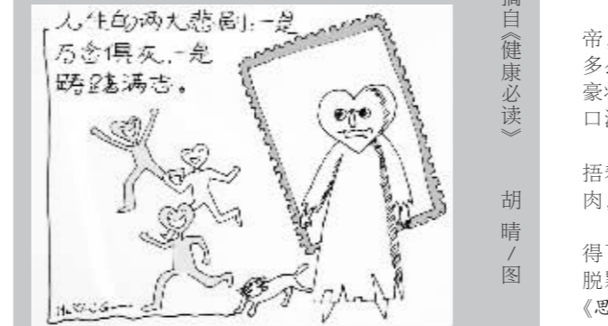
人生两大悲剧:一是万念俱灰,一是踌躇满志。