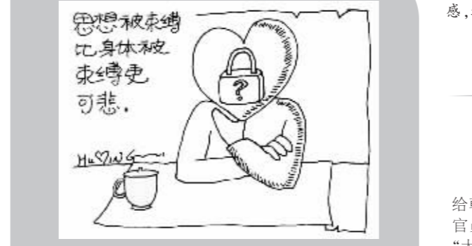
思想被束缚比身体被束缚更可悲。

▲理发厅里,一位顾客颤抖着声音问理发师:“你们这里为什么摆了这么多恐怖照片?”理发师回答:“噢!那是为了让客人吓得毛发竖立起来,好修发型啊!”(摘自《青年一代》第10期)