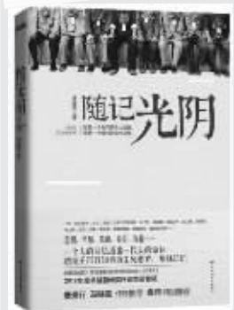
《随记光阴》作者:乔海燕 百花洲文艺出版社

《随记光阴》作者曾经历上个世纪六七十年代的知青青年上山下乡运动,有着丰富的写作素材,本书一篇篇故事中的主人公都来自于作者在那个时代的亲身经历,这些生动鲜明的人物,通过作者细腻深刻的笔触栩栩如生地呈现在读者面前。这些人物里,有为了逃避家庭而想去西藏的医生,有为朋友而甘愿下乡的好人,有在被禁锢的时代仍然保持独立思考的思想者,有把小火车拦下就为看个究竟的村长……这些普通人在大时代横截面中的离合悲欢、辛酸过往,折射出时代的动荡变迁对个人命运运作的左右和影响。