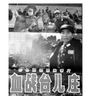
《血战台儿庄》电影海报

台儿庄战役作为抗日战争中最辉煌的胜利之一,其意义不言而喻。五万将士用鲜血换来了歼敌一万余人的战果,这场胜利不仅打破了日军不可战胜的神话,更是给全体军民注入了一剂强心针。