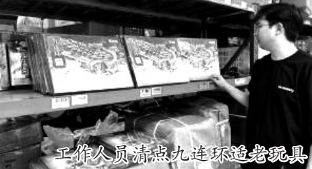
工作人员清点九连环适老玩具

智能棋盘、手腕球、回弹健身球……随着我国老龄化进程加快,一个曾被忽视的消费领域——适老玩具,正悄然成为银发经济的增长点。