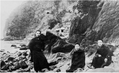
▲周恩来(中)在日本留学期间留影

他从小在封建的大家庭挣扎,深恶世态炎凉、虚伪,更加喜爱“自然的美,无碍的心”。他喜爱樱花“自然的美,不假人工,不受拘束”。由此发出:想起那宗教、礼法、旧文艺……粉饰的东西,还在寻讲什么信仰、情感,美观……的制人学说。