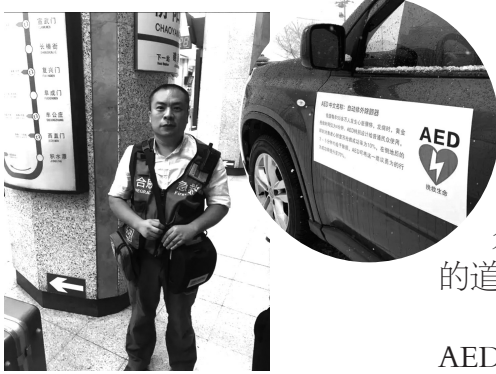
▲田锺背着AED在地铁站值守。