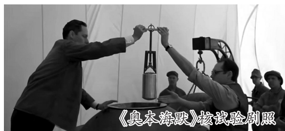
《奥本海默》核试验剧照

美国影片《奥本海默》展示了全球第一款核武器的研发过程。细心的观众发现,影片中的科学家没做任何防护,甚至连防护手套都没戴——他们不担心遭受核辐射吗?事实上,特定的历史条件和环境,导致“曼哈顿计划”中发生了两起可怕的核辐射事故。