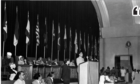
1955年4月,周恩来率中国政府代表团赴印度尼西亚参加万隆会议。