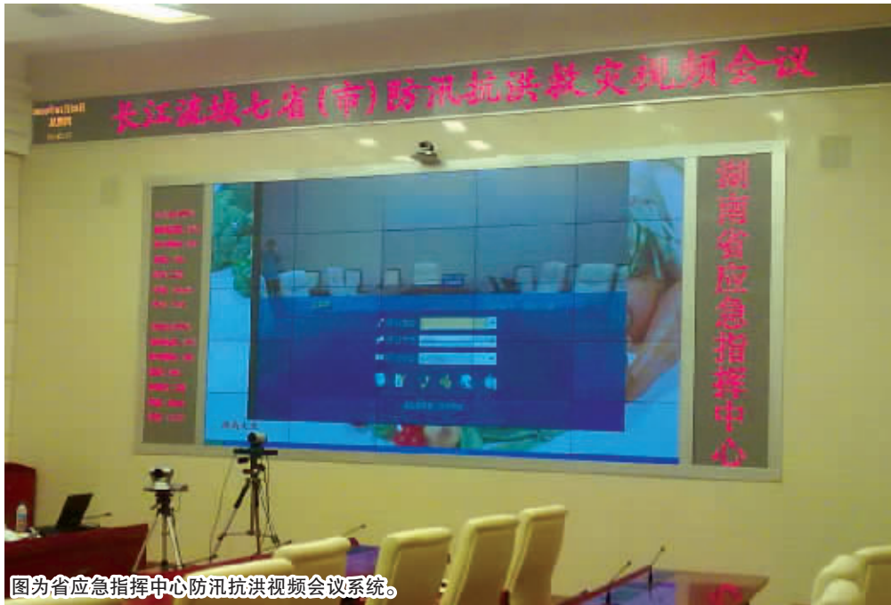
图为省应急指挥中心防汛抗洪视频会议系统。

数据实现不同地域的个人或群体实时的沟通，以达到召开会议、进行交流的目的。视讯技术实现了语音、图像、数据等信息综合在一起的远距离传输，使人们在进行异地交流时利用视讯技术既可以听到对方的声音，又可以看到对方的活动图像和胶片内容，大大增强了异地交流的亲切感和临场感。该视频会议系统覆盖省内相关厅局和14个地市，由于应急指挥系统涉及到多个部门、机构，在重大事件的处理过程中，往往出现多个部门之间共同讨论、提供信息的情况。基于该视频会议系统，应急指挥中心人员与各个相关部门人员能够实现最快的面对面沟通，有利于中心人员最快速、最准确、最直观地收集到所需信息，以做出正确的指挥和决策。监控系统是应急指挥中心的另一个核心部分，与视频会议系统有机连接，视讯/监控系统通过数字方式无缝融合，可以任意调用监控图像到视频会议中观看讨论，促进集体决策，形成一套完善的应急联动方案，为快速精确的决策奠定良好基础。