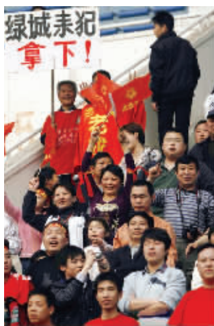
中超球市“异常”火爆。