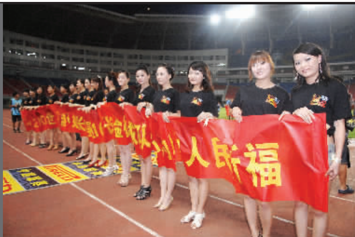
世界旅游小姐现场为舟曲灾区人民募捐。记者 范远志 摄