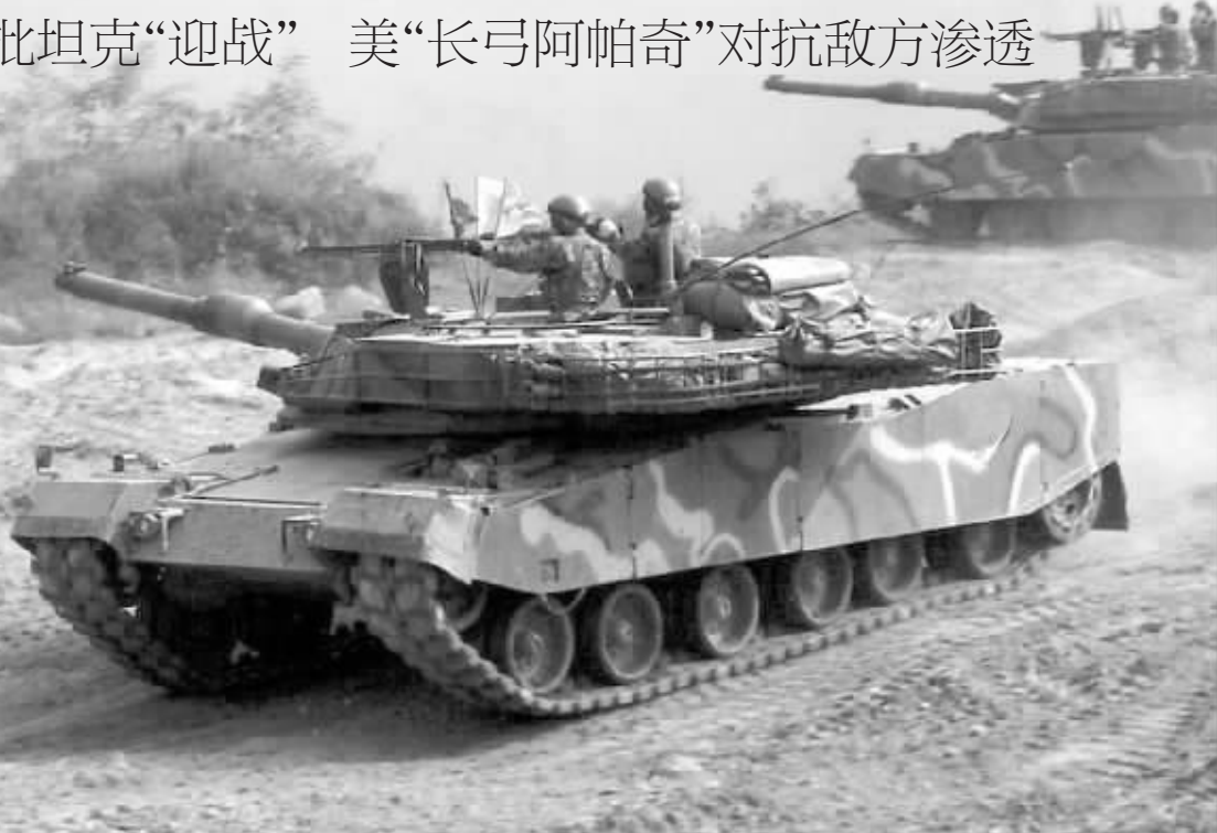
韩国首都师白虎团的K1A1主战坦克。

据韩国媒体报道，随着16日“演习开始”命令正式下达，韩国陆海空三军各级部队立即转入战时状态。韩国国军机务司令部全面启动信息防护态势，对遭到朝军网络部队“攻击”的政府、军队重要网站进行IP追踪、网站恢复工作，并与美军新成立的网络司令部展开联合网络反击。