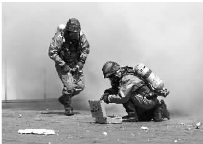
8月17日，韩国特种部队在“乙支自由卫士”演习中，演练围剿“进入城市破坏的朝鲜特种部队”。