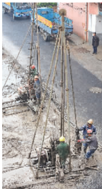
4月19日下午,长沙市营盘路隧道施工现场。施工人员在进行隧道地质勘探的同时,隧道已于近日开挖正洞。