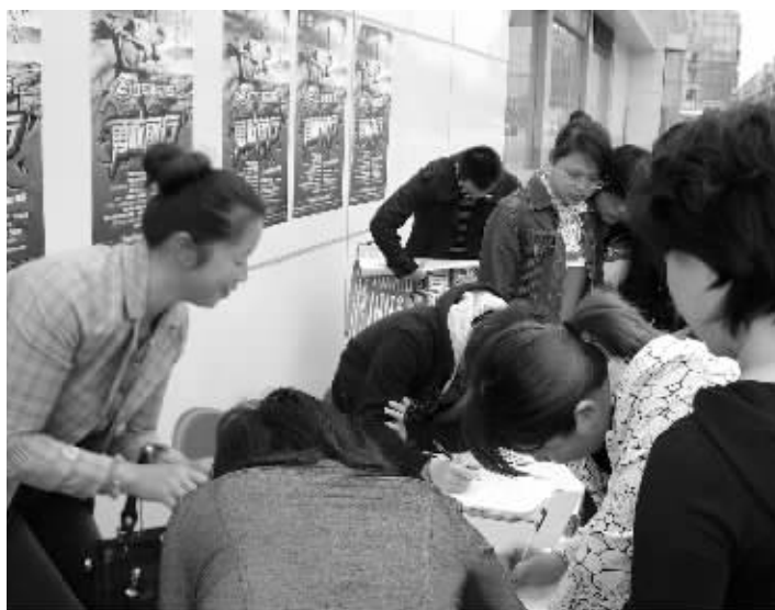
湖南赛区三百报名者“勇敢前行”,据说凤姐也要来过把飞车瘾。

4个月报名热线全省“通缉”,7大分赛区海选启动预热,3天现场报名通道火热开启……历经“千呼万唤”,立马电动车“勇敢前行”湖南主赛区海选17日正式开锣,而湖南辣妹子们也不会“犹抱琵琶半遮面”,她们将大方上道,豪迈“飞车”。