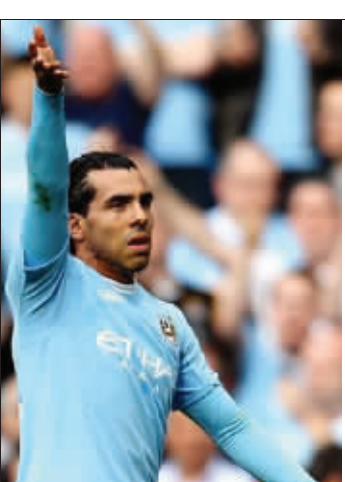
特维斯要阻击老东家。