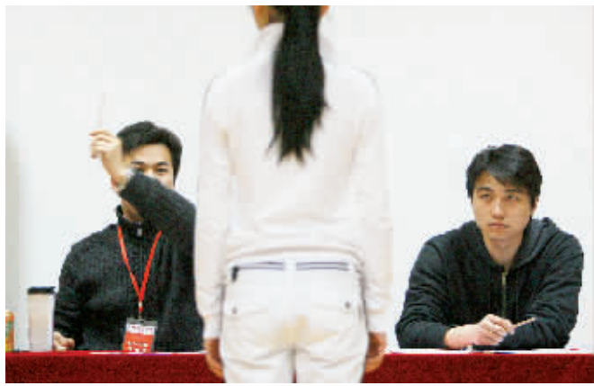
考试背后有猫腻,真才实学很受伤。