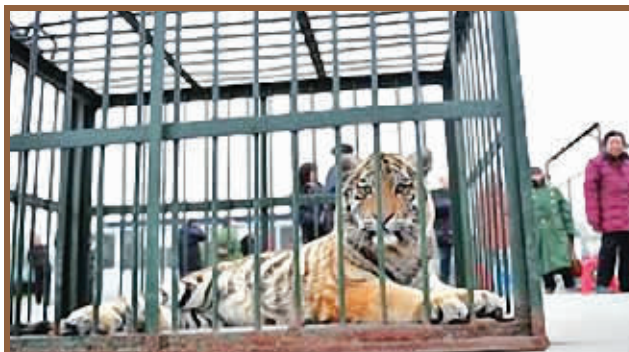
动物园“维权”,拉狮子老虎助威,动物园职工将老虎“请”至运管中心。

郑州市动物园的50亩土地,1984年被政府划拨给河南省体育局,用于修建自行车比赛场地。有关部门约定两年后如数偿还,然而至今没有归还。动物园听说划出的地块现在要进行商业开发,便于11日凌晨将狮子、老虎装进笼子里,运到河南省自行车现代五项运动管理中心,作为“外援”帮助讨地。(《河南商报》4月12日)