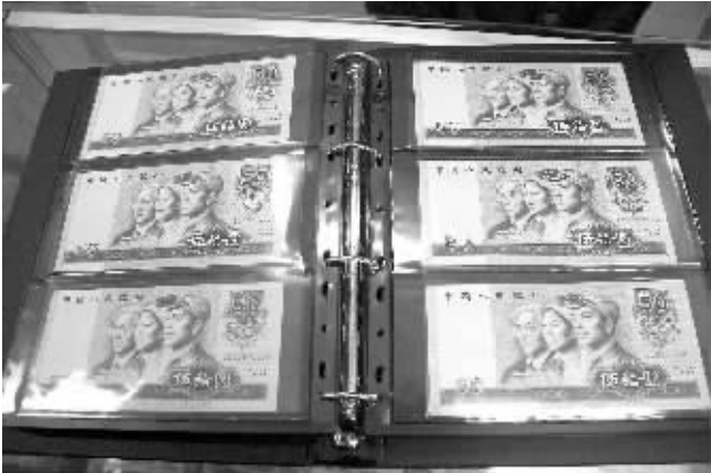
第四套80版50元人民币。

“但根据以往惯例,倘若新版和旧版人民币混合流通时间达到8年以上,流通市场中的旧版币就将被新版币完全替换。也就是说,第四套人民币