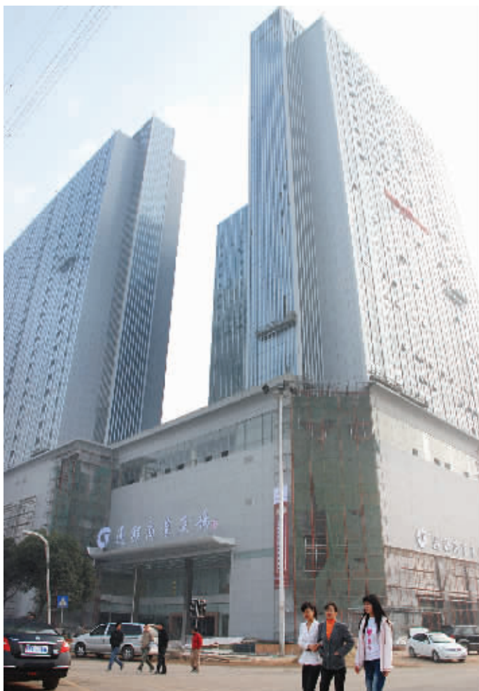
1月30日,红星通程商业广场将揭开神秘面纱。

将酒店与商业广场、生活超市跨业态进行整合。总经营面积6万多平方米,仅百货卖场营业面积即达4万平方米,超市1万平方米,覆盖高、中、低端商品流通。拥有豪华客房275套,以通程五星级服务体系打造的四星级商