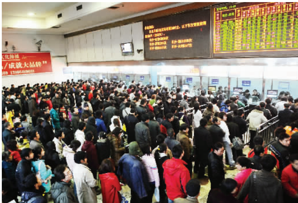
1月21日,长沙火车站,排队买票的人群熙熙攘攘。