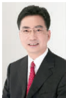
杭州市原副市长许迈永。

杭州市原副市长许迈永案已于12月22日正式移送浙江省检察院。此前, 该案由中纪委督办, 其中牵涉了杭州多