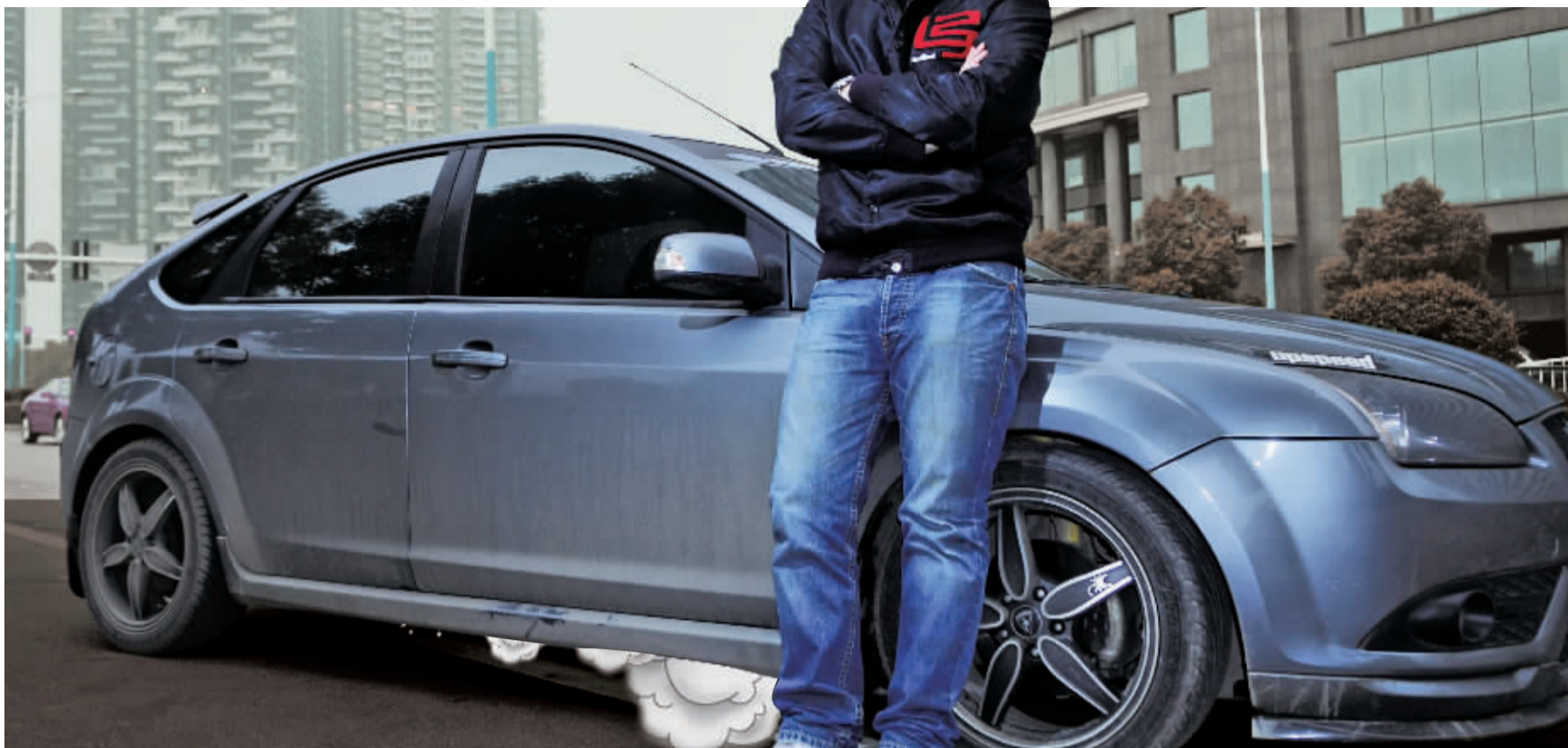
在公路上车身360度旋转后,释放出了最大的安全极限。