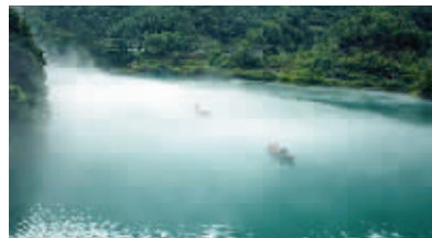
郴州 雾漫小东江(资料图片)。

优惠措施: 在武广高速载客试运营后的第一周,对乘坐武广高速列车来衡旅游的游客进入包括南岳衡山在内的全市所有A级景区实行门票全免。