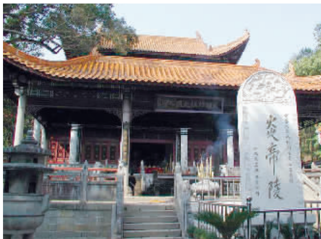
株洲炎帝陵(资料图片)。

当地特产: 醴陵陶瓷、醴陵花炮;攸县豆腐、攸县辣椒;茶陵魔芋;炎陵清水笋、奈李。