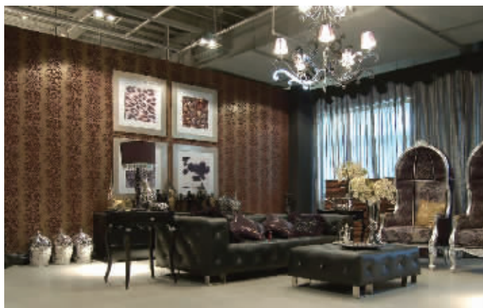
东易日盛艺术感官风格样板间

近日，中国完整家装领跑者东易日盛年底再次发力，带来家装新概念——“有机整体家装”，声称这种家装能让家成为一个有机生物体。