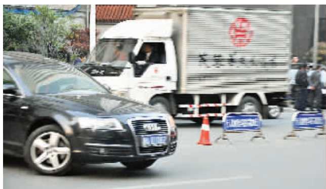
镜头四:小车违章掉头 时间:12月9日下午5时许 地点:解放路文艺路口