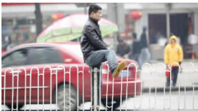
镜头三:车流中行“跨栏” 时间:12月9日下午3时49分 地点:五一大道三泰街出口路段