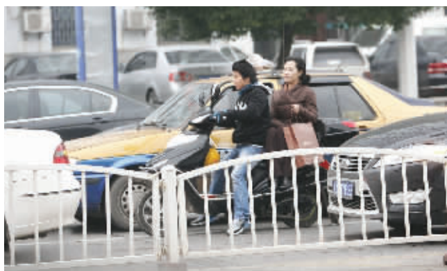
镜头二:电动车载人抢入机动车道 时间:12月9日下午4时17分 地点:营盘路蔡锷路口