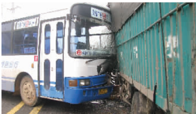
镜头一:一行人横穿马路引发两车相撞 时间:12月9日11时30分 地点:株洲大道尚格名城附近