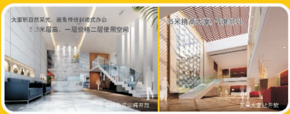
大面积自然采光,避免传统封闭式办公 5.5米层高,一层价格二层使用空间