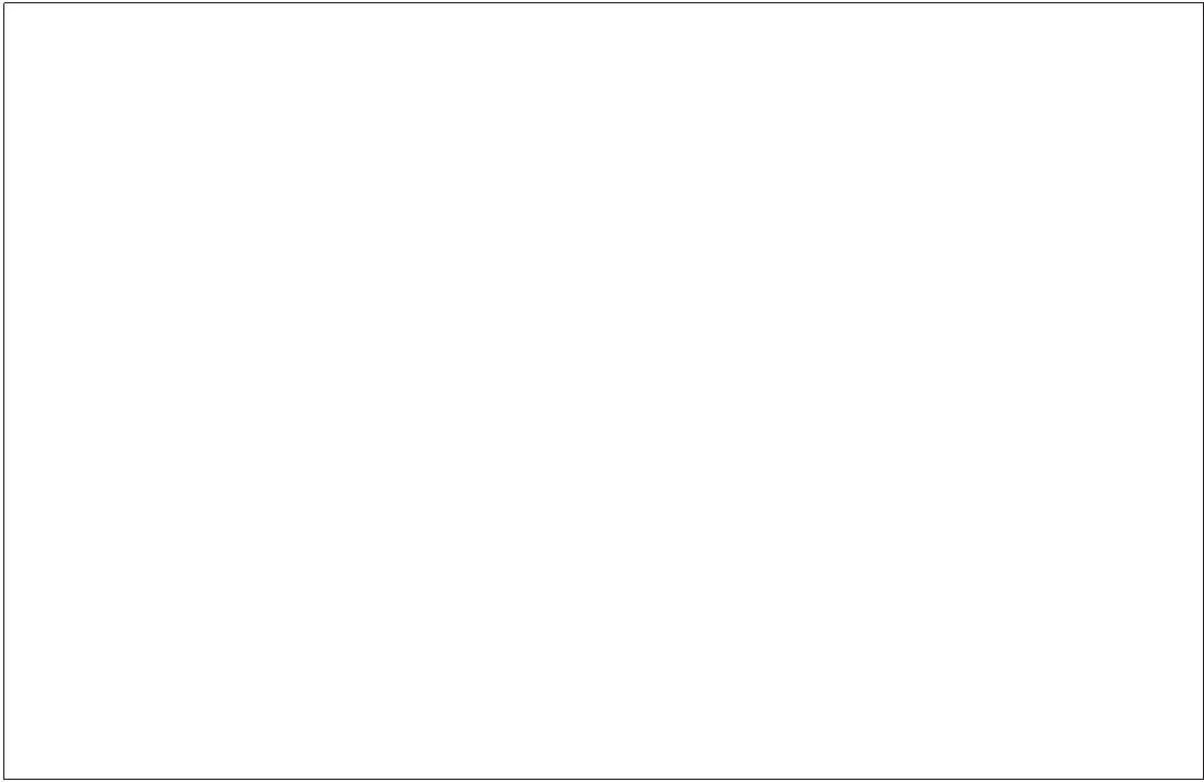
6月11日，湖南宾馆，盖尔国际公司董事会主席斯坦·盖尔向省委副书记、省长周强（左二）赠送梅溪湖规划设计

“我们期待梅溪湖成为推动中美、湖南同美国、以及欧美其他国家包括东亚其他国家合作的平台。”周强省长勉励，省政府将全力支持并重点推介梅溪湖。