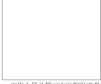
工作人员为第三次发掘做准备