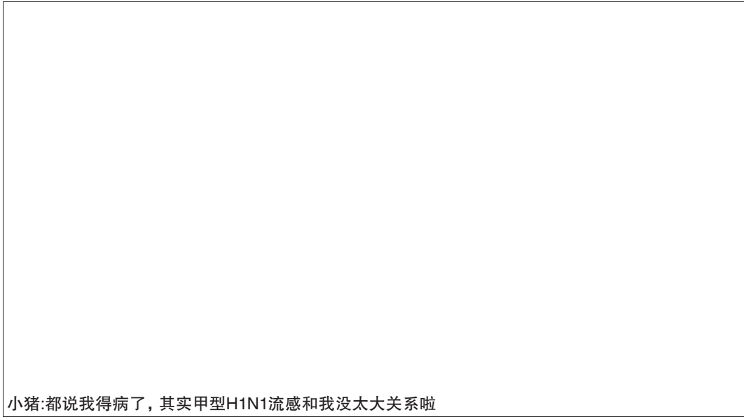
小猪:都说我得病了,其实甲型H1N1流感和我没太大关系啦