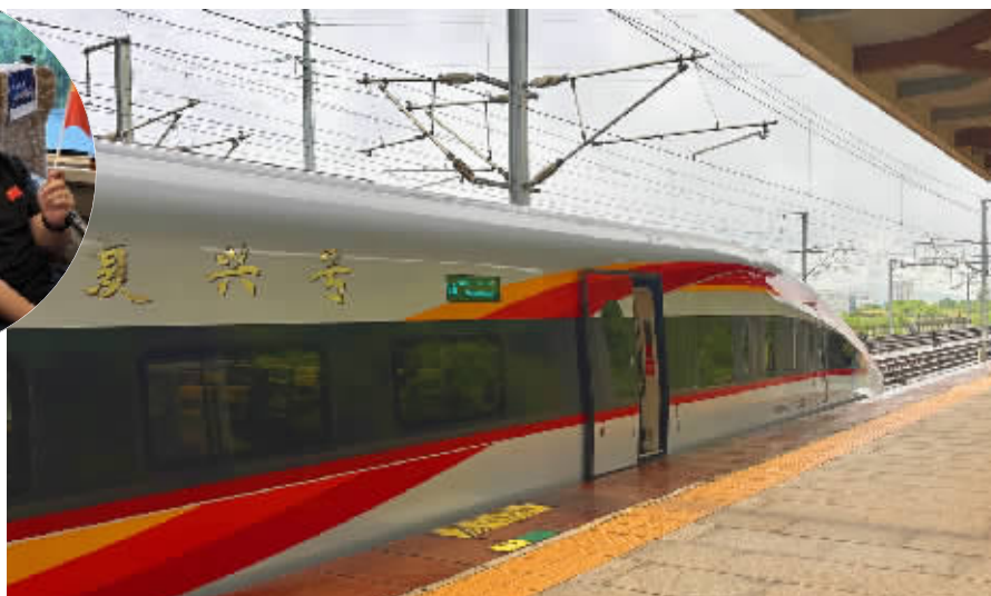
G3854次列车停靠在韶山南站等待首发。