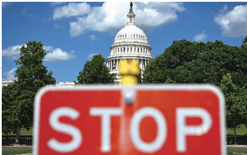
这是6月7日拍摄的美国首都华盛顿国会大厦和交通标志。