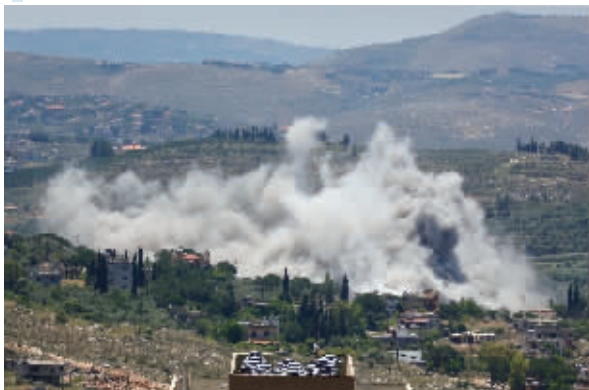
6月10日,在黎巴嫩南部塞尔巴镇,遭以军空袭的地点冒出浓烟。