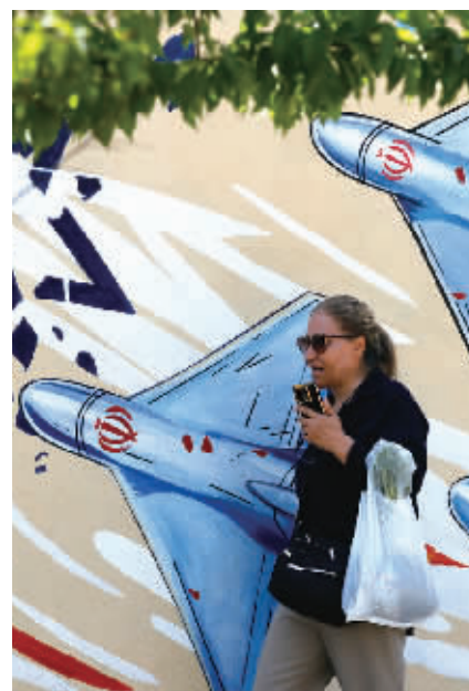
6月8日，一名女子在伊朗首都德黑兰街头行走。