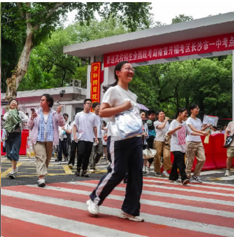
6月7日,高考第一天,长沙市一中考点外,家长等待放考(左图),出场的学子们略显轻松(右图)。