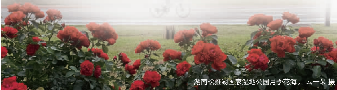
湖南松雅湖国家湿地公园月季花海。