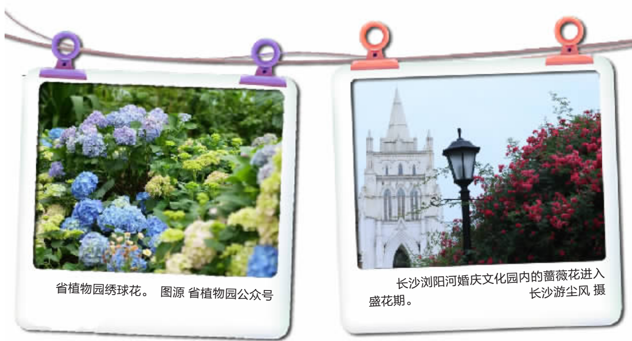
省植物园绣球花。