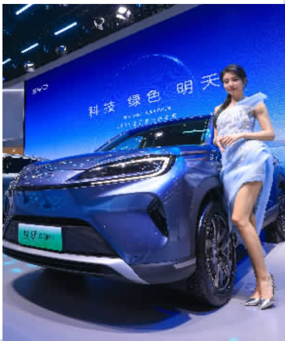
往年湖南车展现场。