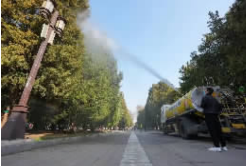
在北京地坛公园，工作人员使用添加了花粉固定剂的水对柏树进行喷淋。

预计，今年春季（3~5月），全国其余大部地区气温接近常年同期到偏高。气温偏高加速树木花芽分化与花粉成熟，也让2026年的花粉过敏季比往年来得更早，影响范围更大。总之，气候变化增加了人体接触花粉的概率，是花粉过敏高发的诱因之一。