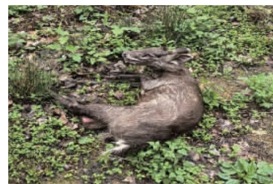
出现在安化的国家二级保护动物毛冠鹿。