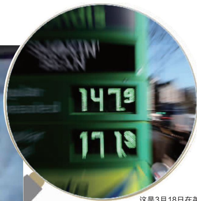
这是3月18日在英国伦敦一处加油站拍摄的油价牌。