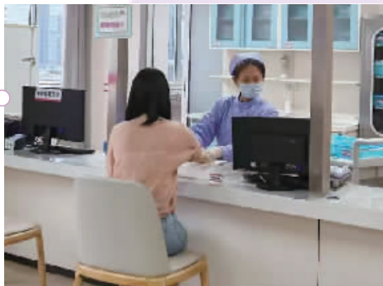
准妈妈在做相关检查(资料图片)。

更让育龄家庭安心的是,2025年3月1日起,湖南将四维彩超纳入生育医疗费用补助范围,解决了孕期关键检查“报销难”的问题;2025年10月1日起,适宜的分娩镇痛项目纳入医保支付,让更多产妇能“无痛生娃”。