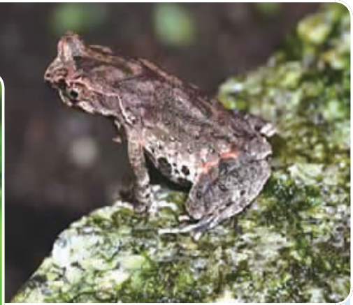
南岳衡山发现的顾菟角蟾。石胜超 摄