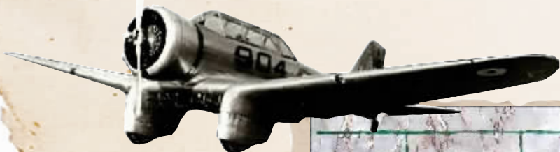
编号为“904”的诺斯罗普轻型轰炸机。