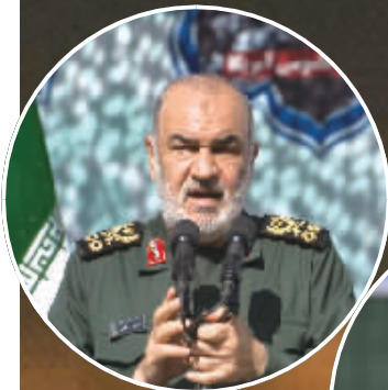
▲ 伊朗伊斯兰革命卫队总司令侯赛因·萨拉米（已证实）