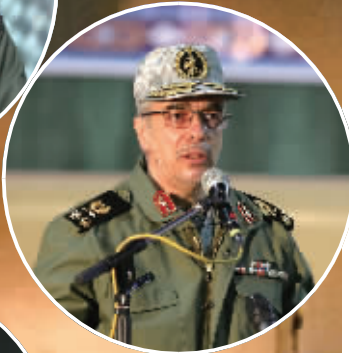
◀ 革命卫队航空航天部队司令阿里·哈吉扎德（已证实）