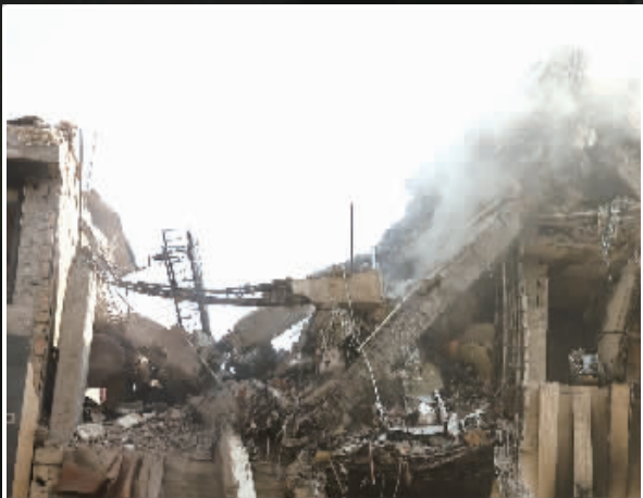
这是6月13日在伊朗首都德黑兰拍摄的爆炸后升起浓烟。