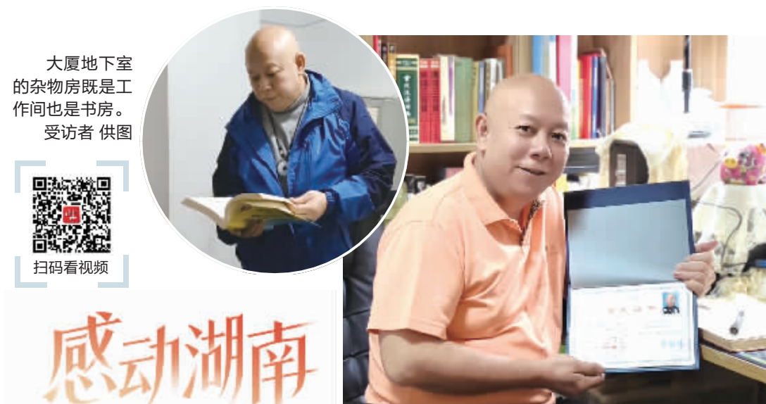
大厦地下室的杂物房既是工作间也是书房。