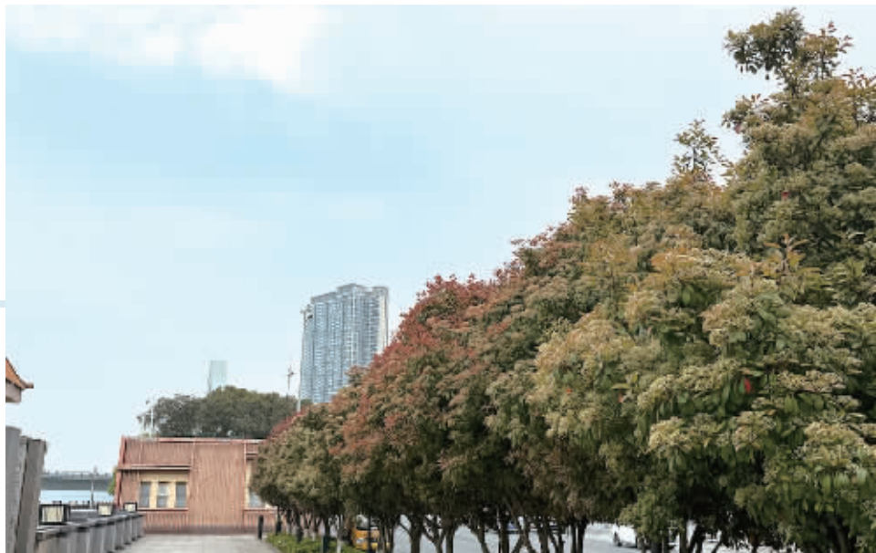
长沙市湘江中路银盆岭大桥下的石楠树。