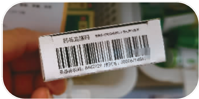
长沙药店的药品,已经带有追溯码。

国家医保局有关负责人提醒,购药时要注意索要保存小票,可将药盒上的追溯码标注在小票上相应药品名称后,并拍照留存,以保留证据,维护合法权益。 药物服用完毕后,建议将空药盒上的追溯码撕毁,不让有心的犯罪分子继续盗用空药盒和追溯码。 同时,不要将自己的药盒或药品出售给“药贩子”。一方面,药品经非法转卖后可能会对他人造成危害;另一方面,如药品在被非法转卖时被发现,将会对自己的医保待遇带来不利影响,严重的还可能涉嫌违法犯罪。