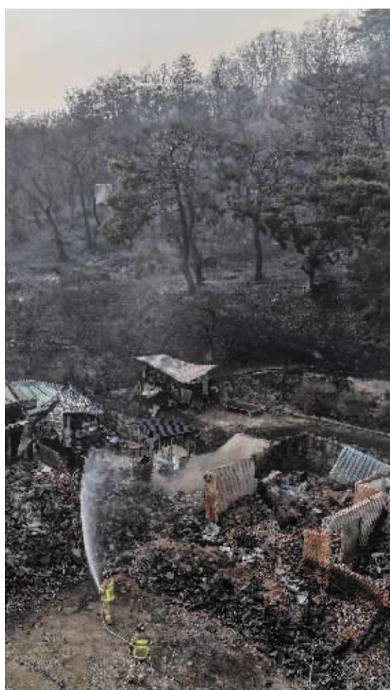
3月23日，消防员在韩国庆尚北道义城郡一座遭山火焚毁的寺庙进行灭火作业。

3月23日，中国驻釜山总领事馆发文提醒领区中国公民注意防范山火灾害。 中国驻釜山总领馆提醒领区中国公民及时留意山火动态，合理安排出行，避免前往相关区域；遵从当地政府避灾、撤离指引；科学防护，减少山火烟尘对健康影响。如遇紧急情况，请及时拨打112报警求助。