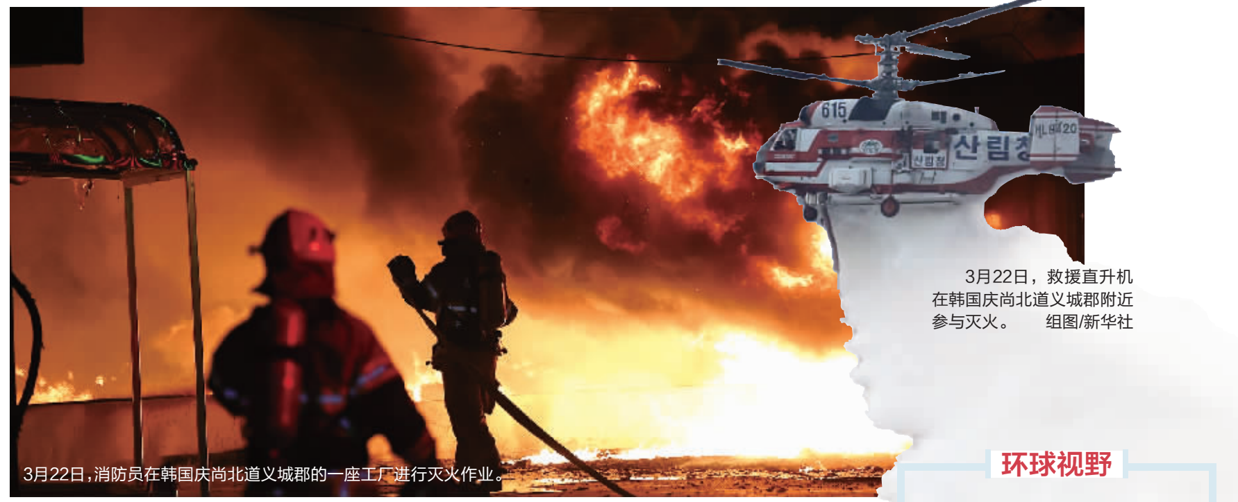
3月22日，消防员在韩国庆尚北道义城郡的一座工厂进行灭火作业。