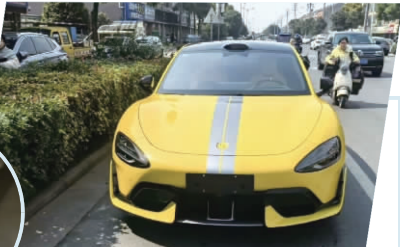
某二手平台有许多用户发布小米SU7 Ultra车标商品图。视频截图

“小米SU7 Ultra车标, 发货时间7天内, 找车不易望谅解。” “小米SU7 Ultra车标, 原装, 维修拆机车标, 24K金, 带原盒, 慎拍, 需要25天内发货。”