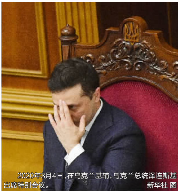
2020年3月4日，在乌克兰基辅，乌克兰总统泽连斯基出席特别会议。