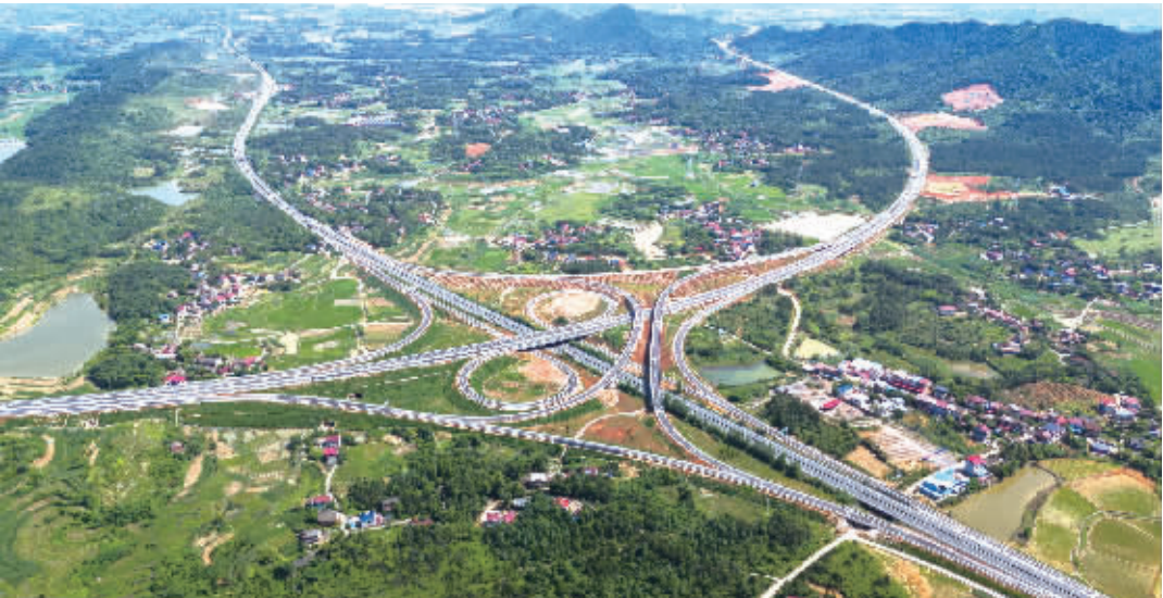
5月28日,永州市冷水滩区牛角坝镇,衡(阳)永(州)、二(连浩特)广(州)高速马坪互通四通八达。