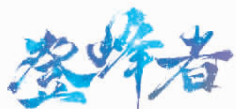
湖南民营企业深度观察系列报道之一

一直就是“心头肉”。2023年,中共湖南省委、湖南省人民政府印发《关于支持民营经济发展壮大的若干政策措施》,要求优化发展环境,加强法治保障,营造良好的氛围。人生海海,时代如峰,他们是湖湘商海中的登峰人。即日起,湖南日报社舜视频、三湘都市报走入湖南知名民营企业,推出“登峰者”专栏,为您讲述湖南民营企业中“光明武士”幕后故事。