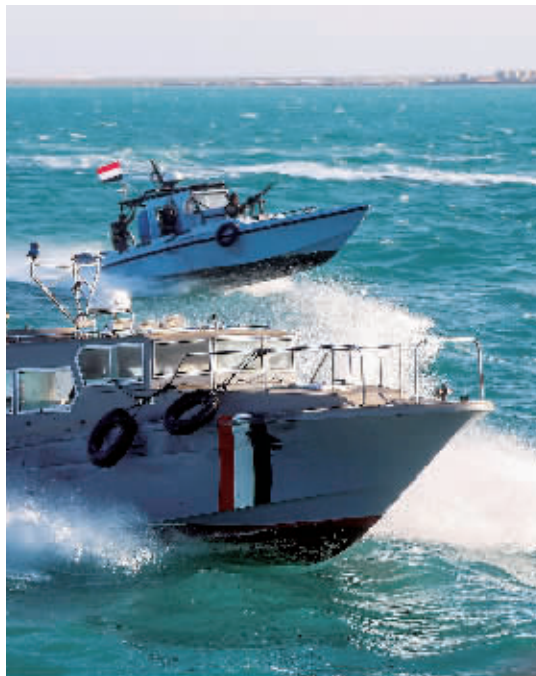
因为红海商船频频遇袭,12月12日,也门海岸警卫队在红海南部的曼德海峡附近巡逻。

日前,美国“旗语”新闻社援引美国政府官员的消息报道称,美国国防部正在考虑打击也门胡塞武装,以回应近期红海频发的船只遭袭事件,不排除会采取更激进的军事行动。 ■综合新华社、央视新闻