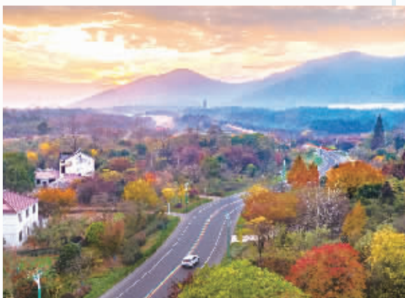
“溧阳1号公路”随手一拍都是风景。

暖暖远人村,依依墟里烟。溧阳的乡村真正成了望得见山、看得见水、记得住乡愁的理想家园。